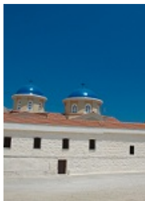
Η Ιερά Μονή της Παναγίας Μυρσινιδίου στη Χίο