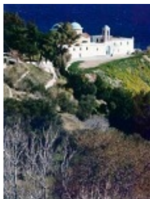
Η Ιερά Μονή της Παναγίας Μυρσινιδίου στη Χίο