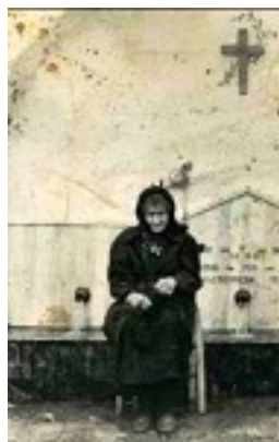
Οσία Σοφία η εν Κλεισούρα ασκήσασα