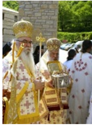
Λιτάνευση των Ιερών Λειψάνων της Οσίας Σοφίας