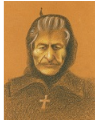
Οσία Σοφία η εν Κλεισούρα ασκήσασα