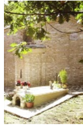
Ο ανακαινισμένος τάφος της Οσίας Γεροντισσας Σοφίας