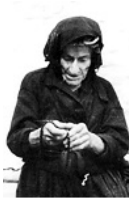
Οσία Σοφία η εν Κλεισούρα ασκήσασα