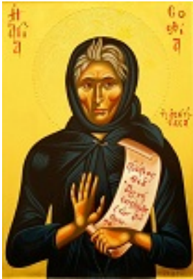
Οσία Σοφία η εν Κλεισούρα ασκήσασα