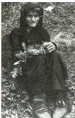
Οσία Σοφία η εν Κλεισούρα ασκήσασα