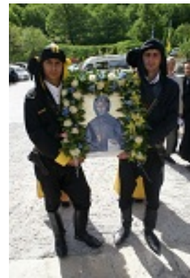
Οσία Σοφία η εν Κλεισούρα ασκήσασα