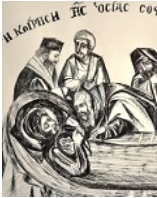
Η κοίμηση της Οσίας Σοφίας της Ποντίας