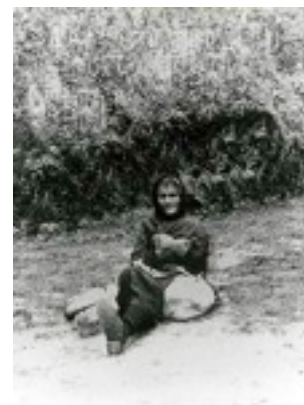
Οσία Σοφία η εν Κλεισούρα ασκήσασα