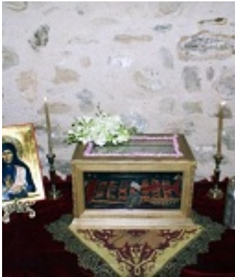
Φωτογραφία από την ανακήρυξη της Γερόντισσας Σοφίας σε Αγία τον Νοέμβριο του 2011 μ.Χ.