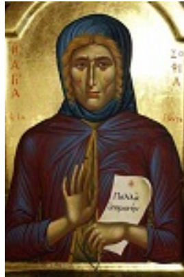
Οσία Σοφία η εν Κλεισούρα ασκήσασα