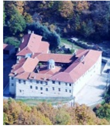
Ιερά Μονή Παναγίας Κλεισούρας