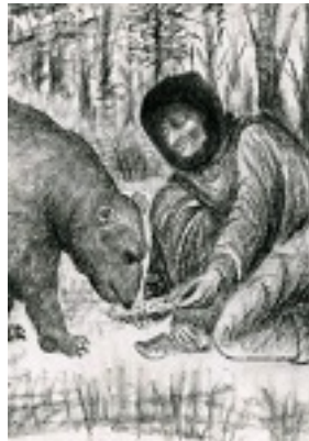
Η Οσία Σοφία η εν Κλεισούρα ταιΐζει μια αρκούδα