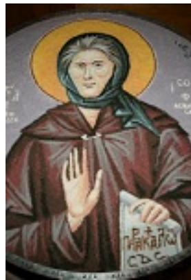
Οσία Σοφία η εν Κλεισούρα ασκήσασα