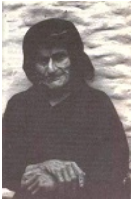
Οσία Σοφία η εν Κλεισούρα ασκήσασα