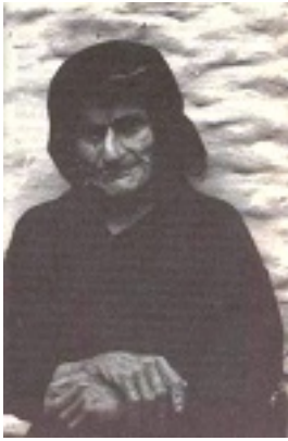
Οσία Σοφία η εν Κλεισούρα ασκήσασα