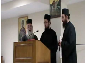
Ακούστε το Απολυτίκιο και το Μεγαλυνάριο!