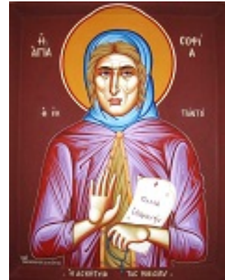
Οσία Σοφία η εν Κλεισούρα ασκήσασα