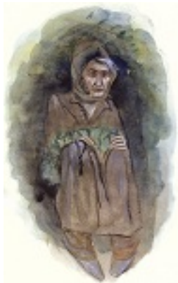
Οσία Σοφία η εν Κλεισούρα ασκήσασα - Προρταίτο της Γερόντισσας από την Ιερά Βατοπαιδινή Σκήτη Αγίου Ανδρέου και Μεγάλου Αντωνίου, Άγιον Όρος