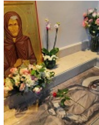
Οσία Σοφία η εν Κλεισούρα ασκήσασα