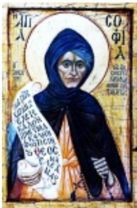
Οσία Σοφία η εν Κλεισούρα ασκήσασα