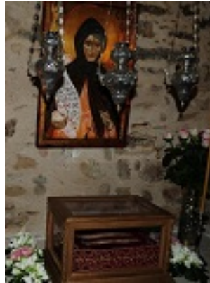
Οσία Σοφία η εν Κλεισούρα ασκήσασα