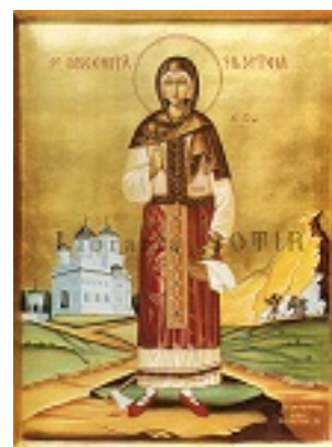
Αγία Φιλοθέη του Άρτζες Ρουμανίας Αγία Φιλοθέη του Άρτζες Ρουμανίας Αγία Φιλοθέη του Άρτζες Ρουμανίας