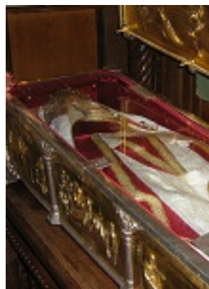
Αγία Φιλοθέη του Άρτζες Ρουμανίας Αγία Φιλοθέη του Άρτζες Ρουμανίας