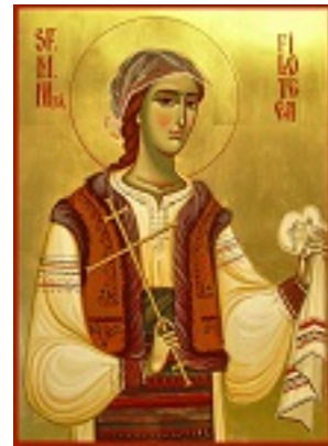
Αγία Φιλοθέη του Άρτζες Ρουμανίας Αγία Φιλοθέη του Άρτζες Ρουμανίας Αγία Φιλοθέη του Άρτζες Ρουμανίας