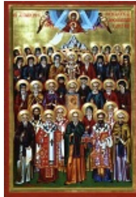
Σύναξη των Αγιορειτών Πατέρων