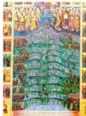
Γενική άποψη του Αγίου Όρους με τα καθιδρύματα, απόστολοι, αρχάγγελοι, μοναχοί και άγιοι (χείρ Γενναδίου Μοναχού) - 1859 μ.Χ. - Ρουμανική Σκήτη Τιμίου Προδρόμου, Άγιον Όρος