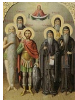
Σύναξη των Αγιορειτών Πατέρων