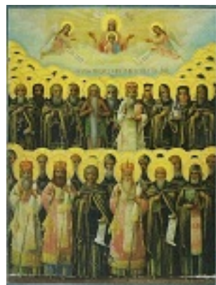
Σύναξη των Αγιορειτών Πατέρων - Φορητή εικόνα Ιεράς Μονής Αγίου Παύλου (αρχές 20ου αιώνα μ.Χ.)