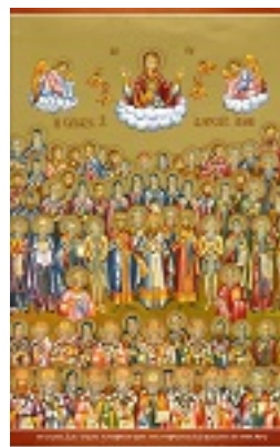
Σύναξη των Αγιορειτών Πατέρων