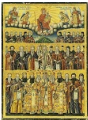
Σύναξη των Αγιορειτών Πατέρων