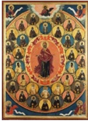
Σύναξη των Αγιορειτών Πατέρων - 18ος αι. μ.Χ. - Πρωτάτο, Άγιον Όρος