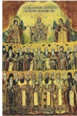
Σύναξη των Αγιορειτών Πατέρων