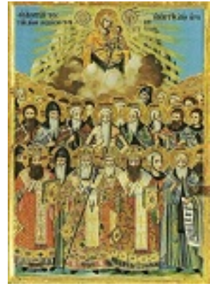
Σύναξη των Αγιορειτών Πατέρων