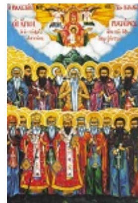
Σύναξη των Αγιορειτών Πατέρων