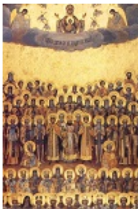
Σύναξη των Αγιορειτών Πατέρων (Ρωσική)