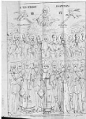
Σύναξη των Αγιορειτών Πατέρων