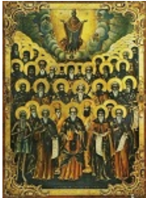
Σύναξη των Αγιορειτών Πατέρων