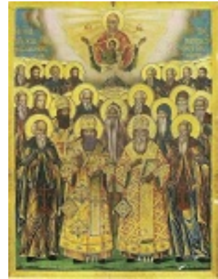
Σύναξη των Αγιορειτών Πατέρων