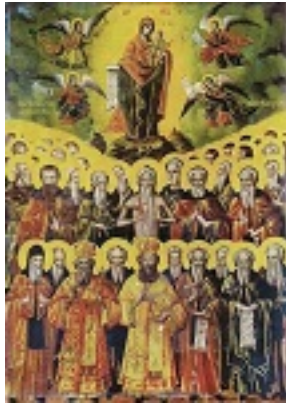
Σύναξη των Αγιορειτών Πατέρων