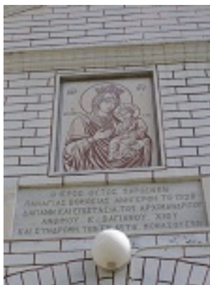
Παναγία η Βοήθεια