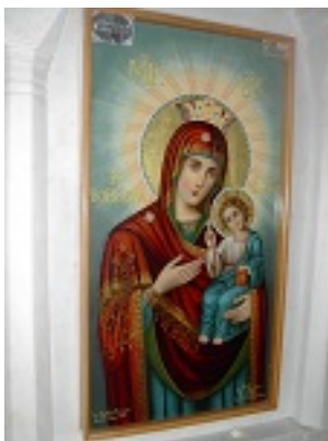
Παναγία η Βοήθεια (Από τον ιερό νάο Αγίου Ανθίμου)