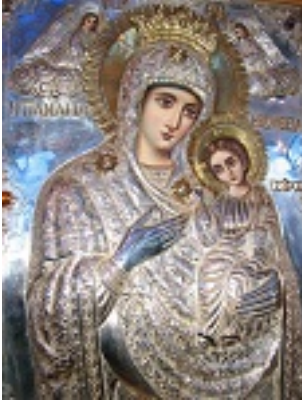
Παναγία η Βοήθεια