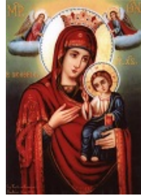
Παναγία η Βοήθεια