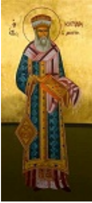
Άγιος Κύριλλος Λούκαρις