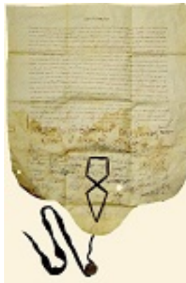
Πατριαρχικό και συνοδικό σιγίλλιο του Κυρίλλου Α' Λουκάρεως (Στο κάτω μέρος, με γαλάζια μήρινθο απαιωρείται μολύβδινη σφραγίδα του πατριάρχη Κυρίλλου Λουκάρεως)- Δεκέμβριος 1633 μ.Χ. - Μονή Ιβήρων, Άγιον Όρος