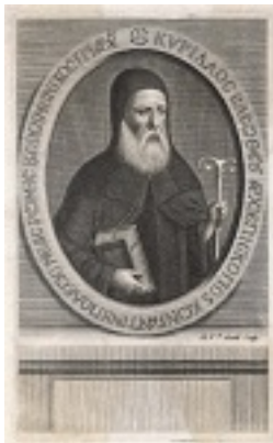
Άγιος Κύριλλος Λούκαρις