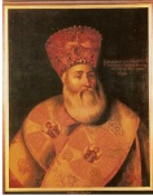
Άγιος Κύριλλος Λούκαρις