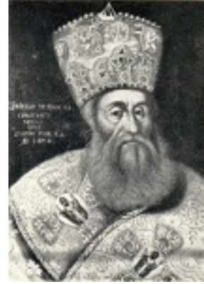
Άγιος Κύριλλος Λούκαρις