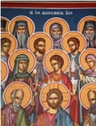
Σύναξις των εν Δωδεκανήσω Αγίων Σύναξις των εν Δωδεκανήσω Αγίων