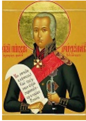
Όσιος Θεόδωρος Ουσακώφ