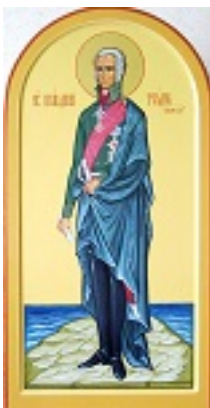
Όσιος Θεόδωρος Ουσακώφ