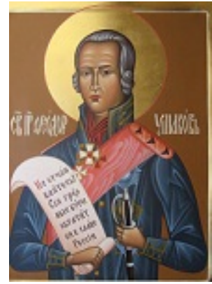
Όσιος Θεόδωρος Ουσακώφ