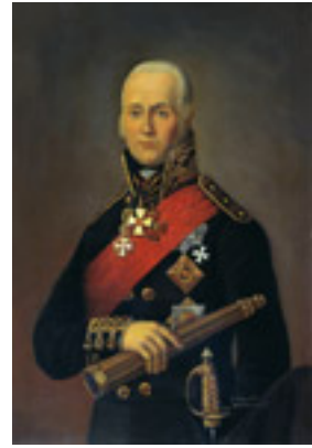
Όσιος Θεόδωρος Ουσακώφ