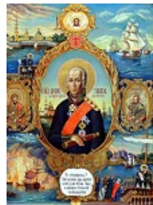
Όσιος Θεόδωρος Ουσακώφ