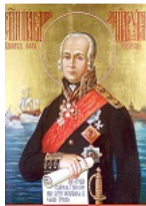
Όσιος Θεόδωρος Ουσακώφ