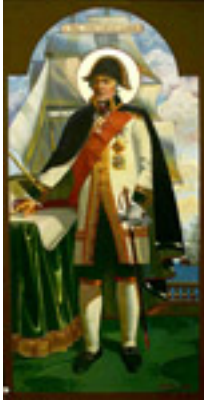
Όσιος Θεόδωρος Ουσακώφ