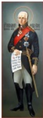
Όσιος Θεόδωρος Ουσακώφ