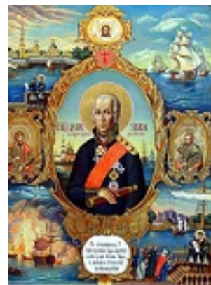
Όσιος Θεόδωρος Ουσακώφ