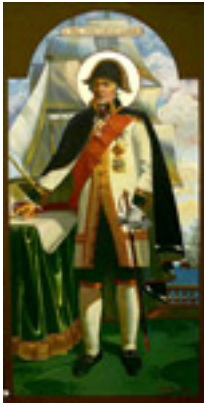
Όσιος Θεόδωρος Ουσακώφ