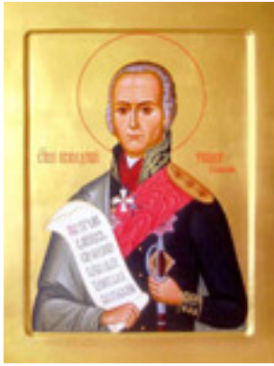
Όσιος Θεόδωρος Ουσακώφ