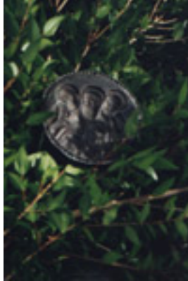
Μολύβδινη κυκλική σφραγίδα με χαραγμένες τις μορφές των τριών Αγίων Θεοφόρων Πατέρων Λευκάδος