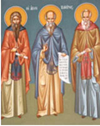
Άγιοι Τρεις Θεοφόροι Πατέρες Λευκάδος