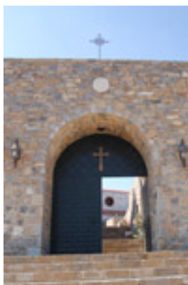
Ι.Μ. Παναγίας Γιάτρισσας στη Μάνη