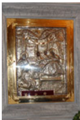
Η Παναγία η Γιάτρισσα στη Μάνη