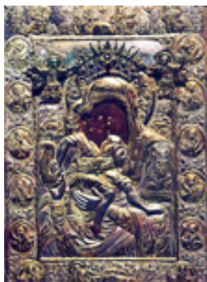
Σύναξη της Παναγίας «Άξιον Ἐστί» (ή ἐν τῷ « Ἄδειν»)