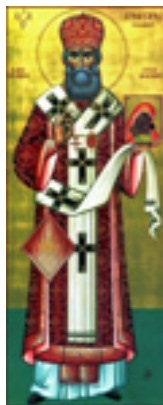
Όσιος Γρηγόριος Καλλίδης