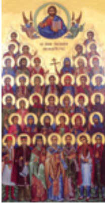
Άγιοι Νεομάρτυρες - Σύγχρονη φορητή εικόνα. Ι. Μ. Ξηροποτάμου