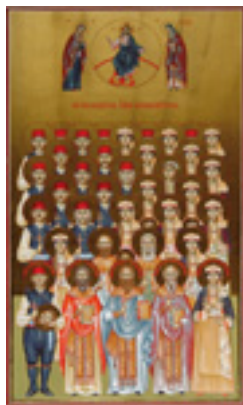
Σύναξη των Χιλίων Διακοσίων Σαράντα Ένα Νεομαρτύρων της Νάουσας