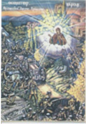
Το θαύμα της Παναγίας Σκριπούς στον Ορχομενό