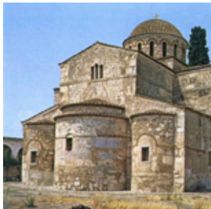
Ο ναός της Παναγίας Σκριπούς στον Ορχομενό