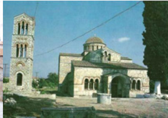
Ο ναός της Παναγίας Σκριπούς στον Ορχομενό