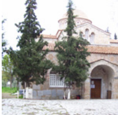
Ο ναός της Παναγίας Σκριπούς στον Ορχομενό