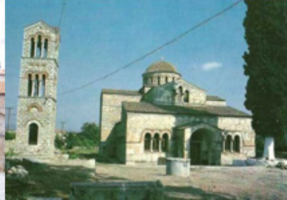
Ο ναός της Παναγίας Σκριπούς στον Ορχομενό