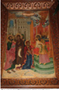
Η εικόνα της Παναγίας στον ναό της Παναγιάς του Μπελώνια (Γεωγραφία του Μπελώνια, στα Φωτά της Βιτοργίας)