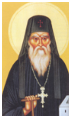
Όσιος Κύριλλος ο Νέος ο εν Πάρω