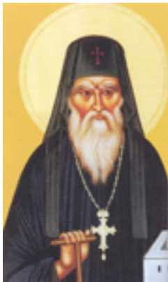
Όσιος Κύριλλος ο Νέος ο εν Πάρω