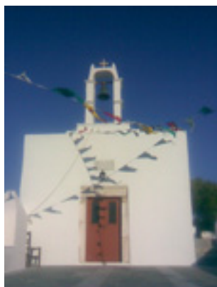
Παναγία η Αγία Υπακοή (Αγία Πακού) αφιερωμένη στην Υπαπαντή