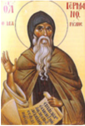
Όσιος Γερμανός ο Αγιορείτης ο Μαρουλής