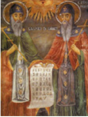
Εικόνα του βούλγαρου αγιογράφου Zahari Zograf (1810 – 1853 μ.Χ.) που βρίσκεται στο μοναστήρι Τρογαν (1848 μ.Χ.)