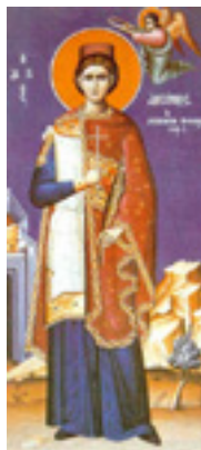
Άγιος Αργύριος ο Επανομίτης ο Νεομάρτυρας