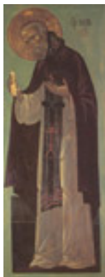
Όσιος Νείλος εκ Ρωσίας