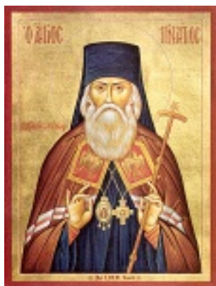
Άγιος Ιγνάτιος Επίσκοπος Σταυρουπόλεως