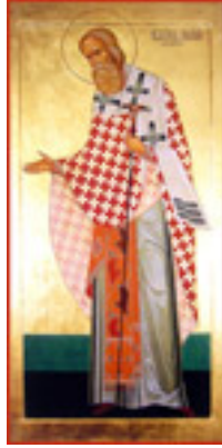
Άγιος Ιγνάτιος Επίσκοπος Σταυρουπόλεως