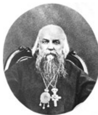
Άγιος Ιγνάτιος Επίσκοπος Σταυρουπόλεως