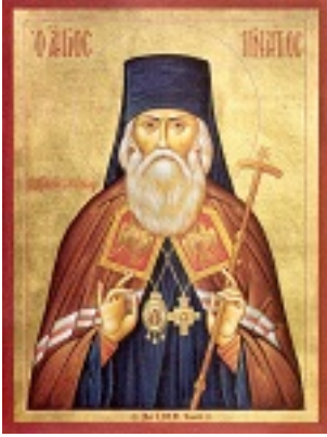
Άγιος Ιγνάτιος Επίσκοπος Σταυρουπόλεως