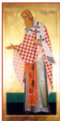
Άγιος Ιγνάτιος Επίσκοπος Σταυρουπόλεως