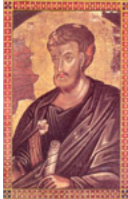
Άγιος Ιάκωβος ο Απόστολος