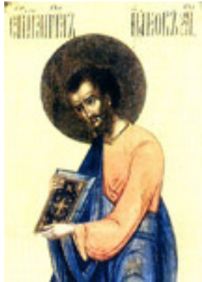
Άγιος Ιάκωβος ο Απόστολος