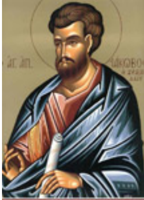
Άγιος Ιάκωβος ο Απόστολος