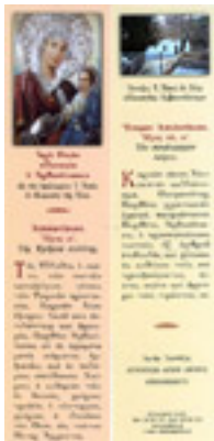
Σελιδοδείκτες για την<br />/>Παναγία Αρβανίτισσα