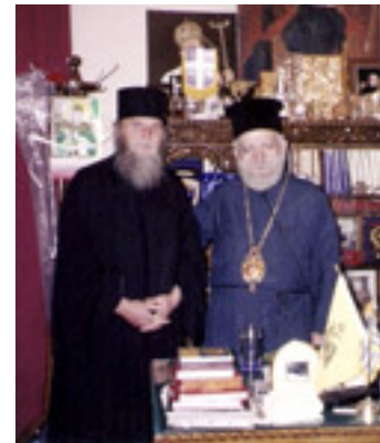
Ο π. Νεκτάριος με τον<br />/>μητροπολίτη Χίου κ.κ. Διονύσιο