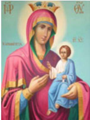
Η Παναγία Αρβανίτισσα<br />/>αγιογραφηθείσα το<br />/>2008 μ.Χ. από την Μονή<br />/>Κουτλουμουσίου Αγίου<br />/>Όρους χωρίς διακόσμηση