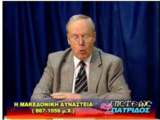
Παναγία Αρβανίτισσα<br />1/2