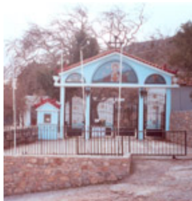
Ο Ναός της Παναγίας<br />/>της Αρβανίτισσας