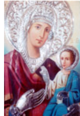
Η εικόνα της Παναγίας<br />/>της Αρβανίτισσας<br />/>στο ναό