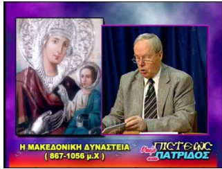
Παναγία Αρβανίτισσα<br />2/2