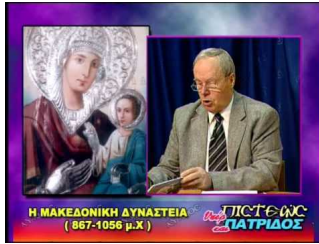
Παναγία Αρβανίτισσα<br />2/2