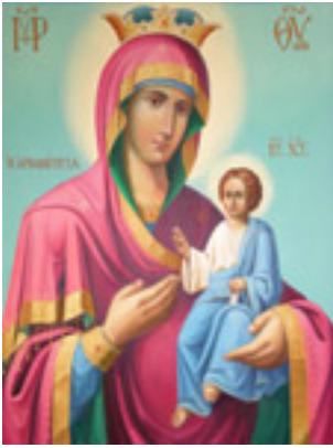
Η Παναγία Αρβανίτισσα<br />/>αγιογραφηθείσα το<br />/>2008 μ.Χ. από την Μονή<br />/>Κουτλουμουσίου Αγίου<br />/>Όρους χωρίς διακόσμηση