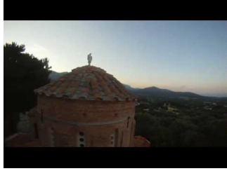
Παναγία Κρίνα Χίου