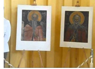
Επέστρεψαν οι κλεμμένες εικόνες της Παναγίας Κρίνας 2