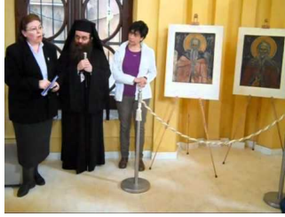
Επέστρεψαν οι κλεμμένες εικόνες της Παναγίας Κρίνας