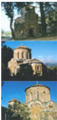
Παναγιά η Κρήνα