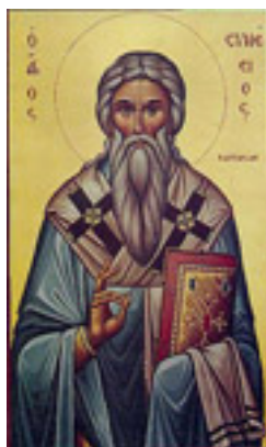
Άγιος Συνέσιος ο Επίσκοπος