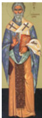
Άγιος Συνέσιος ο Επίσκοπος