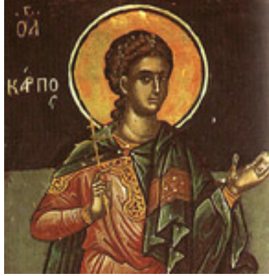
Άγιος Κάρπος ο Απόστολος<br />από τους Εβδομήκοντα