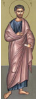
Άγιος Κάρπος ο Απόστολος<br />από τους Εβδομήκοντα