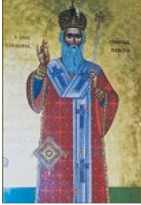
Άγιος Ευθύμιος ο Θαυματουργός Επίσκοπος Μαδύτου