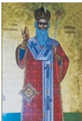
Άγιος Ευθύμιος ο Θαυματουργός Επίσκοπος Μαδύτου