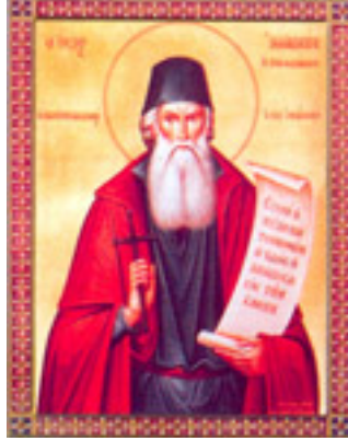
Όσιος Ιωακείμ / ο Ιθακήσιος