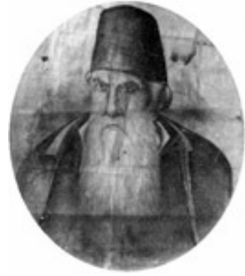
Όσιος Ιωακείμ / ο Ιθακήσιος