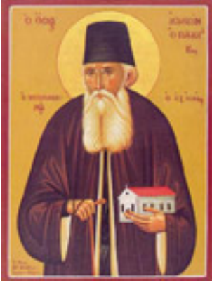
Όσιος Ιωακείμ / ο Ιθακήσιος