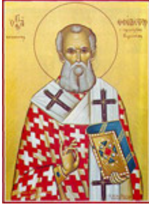
Άγιος Θεόδοτος<br />επίσκοπος Κυρήνειας<br />Κύπρου