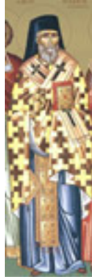
Άγιος Θεόδοτος<br />επίσκοπος Κυρήνειας<br />Κύπρου