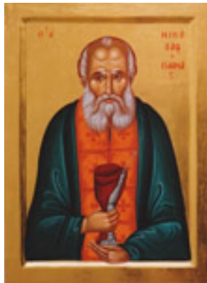
Άγιος Νικόλαος ο Πλανάς