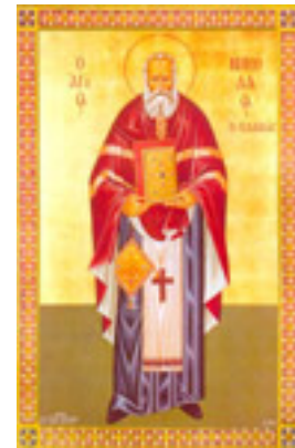
Άγιος Νικόλαος ο Πλανάς