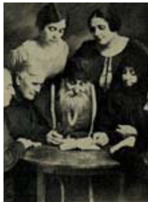
Άγιος Νικόλαος ο Πλανάς