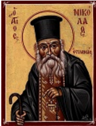
Άγιος Νικόλαος ο Πλανάς