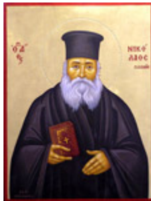
Άγιος Νικόλαος ο Πλανάς