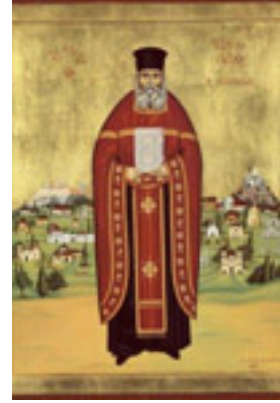
Άγιος Νικόλαος ο Πλανάς