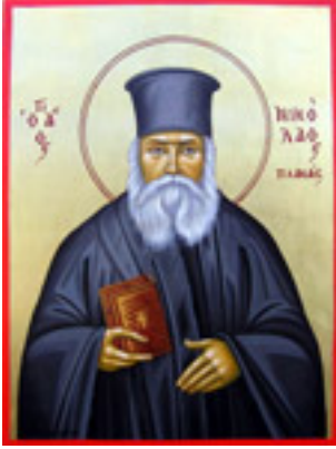
Άγιος Νικόλαος ο Πλανάς