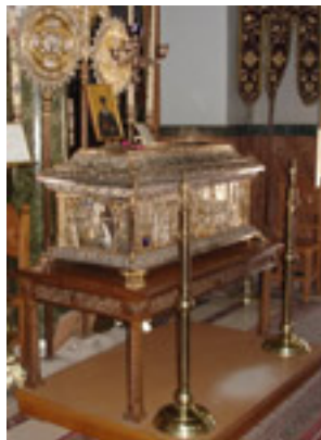
Η λειψανοθήκη του Αγίου Νικόλαου Πλανά