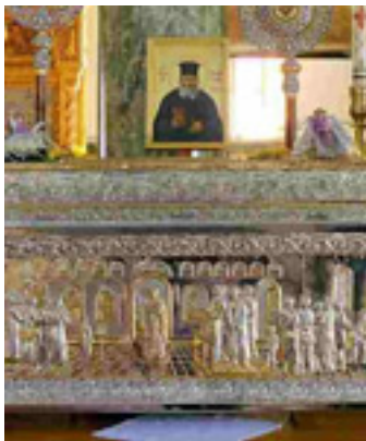
Η λειψανοθήκη του Αγίου Νικόλαου Πλανά