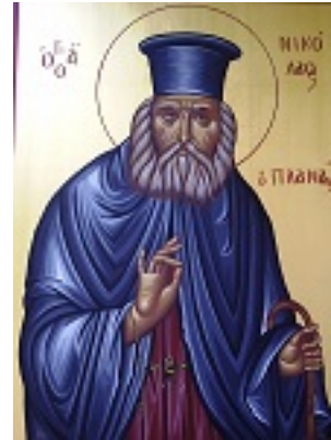
Άγιος Νικόλαος ο Πλανάς - Χρωστήρας© (xrostiras.blogspot.com)