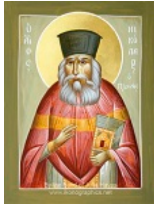
Άγιος Νικόλαος ο Πλανάς - Julia Hayes© (www.ikonographics.net)