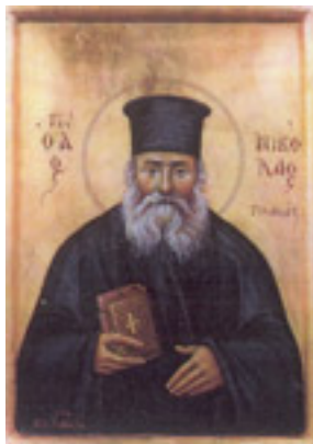
Άγιος Νικόλαος ο Πλανάς