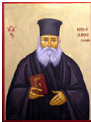
Άγιος Νικόλαος ο Πλανάς