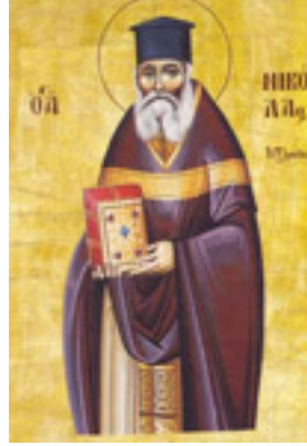
Άγιος Νικόλαος ο Πλανάς