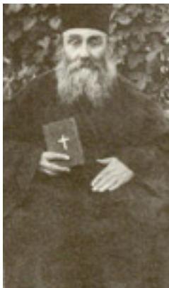
Άγιος Νικόλαος ο Πλανάς