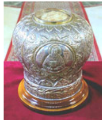
Η κάρα του Αγίου Νικόλαου του Πλανά