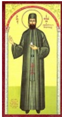
Άγιος Εφραίμ ο Μεγαλομάρτυρας και θαυματουργός