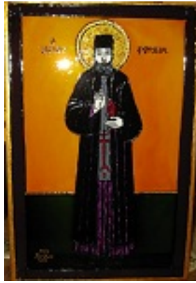
Άγιος Εφραίμ ο Μεγαλομάρτυρας και θαυματουργός