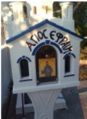
Άγιος Εφραίμ ο Μεγαλομάρτυρας και θαυματουργός