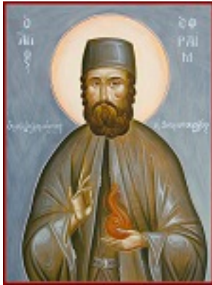
Άγιος Εφραίμ ο Μεγαλομάρτυρας και θαυματουργός - Julia Hayes© (www.ikonographics.net)