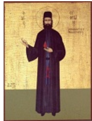
Άγιος Εφραίμ ο Μεγαλομάρτυρας και θαυματουργός