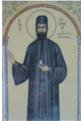
Άγιος Εφραίμ ο Μεγαλομάρτυρας και θαυματουργός