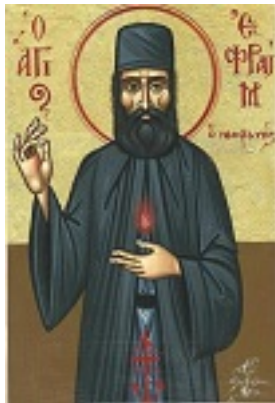
Άγιος Εφραίμ ο Μεγαλομάρτυρας και θαυματουργός