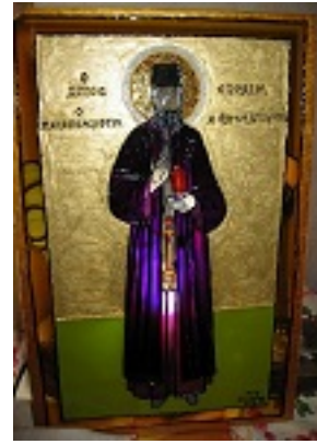
Άγιος Εφραίμ ο Μεγαλομάρτυρας και θαυματουργός