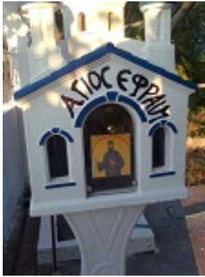
Άγιος Εφραίμ ο Μεγαλομάρτυρας και θαυματουργός