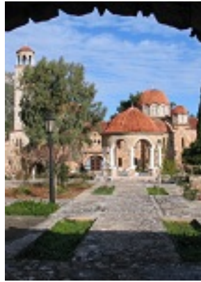
Ιερά Μονή Αγίου Εφραίμ