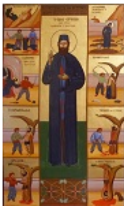
Το μαρτύριο του Αγίου Εφραίμ