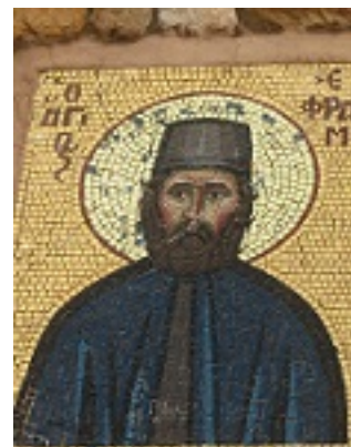
Άγιος Εφραίμ ο Μεγαλομάρτυρας και θαυματουργός