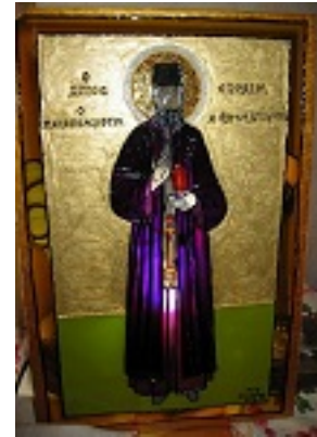
Άγιος Εφραίμ ο Μεγαλομάρτυρας και θαυματουργός