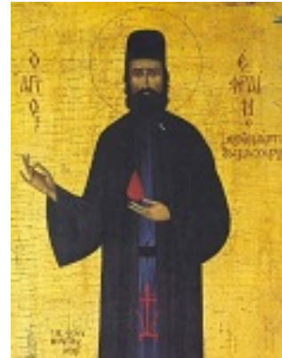
Άγιος Εφραίμ ο Μεγαλομάρτυρας και θαυματουργός