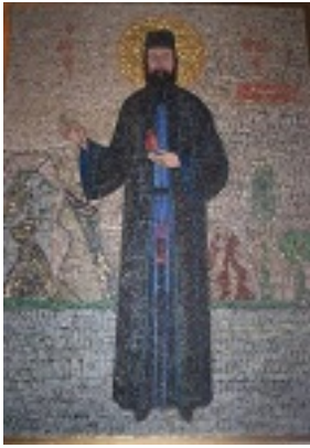
Άγιος Εφραίμ ο Μεγαλομάρτυρας και θαυματουργός