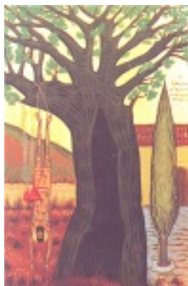
Το μαρτύριο του Αγίου Εφραίμ