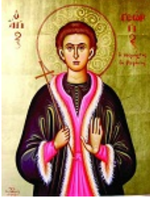
Άγιος Γεώργιος ο Νεομάρτυρας εκ Ραψάνης