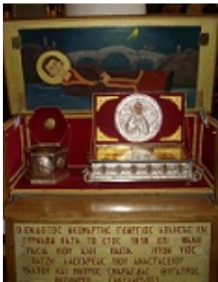
Άγιος Γεώργιος ο Νεομάρτυρας εκ Ραψάνης