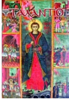
Άγιος Γεώργιος ο Νεομάρτυρας εκ Ραψάνης