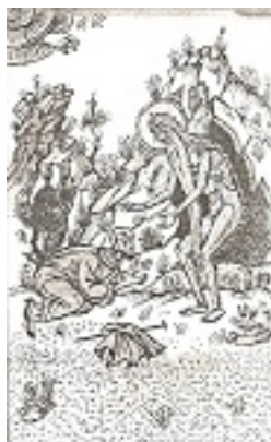
Όσιος Μάρκος ο Αθηναίος