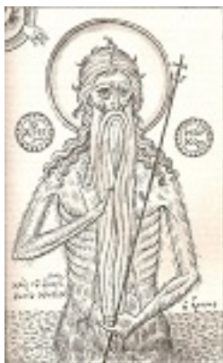
Όσιος Μάρκος ο Αθηναίος - Φώτης Κόντογλου