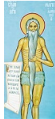
Όσιος Μάρκος ο Αθηναίος