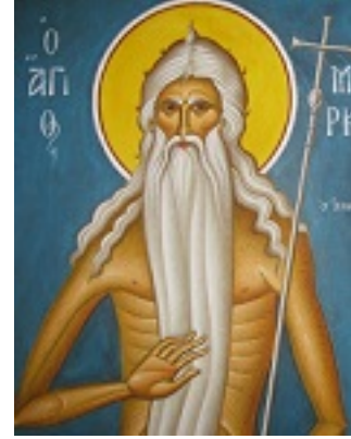
Όσιος Μάρκος ο Αθηναίος