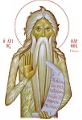
Όσιος Μάρκος ο Αθηναίος