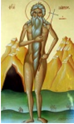
Όσιος Μάρκος ο Αθηναίος - Μιχαήλ Χατζημιχαήλ© www.michaelhadjimichael.com