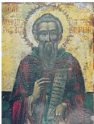
Όσιος Κόνων<br />ο εκ Κύπρου