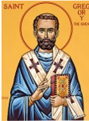
Όσιος Γρηγόριος ο Α' Διάλογος Πάπας Ρώμης