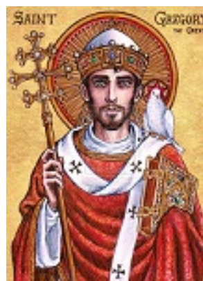
Όσιος Γρηγόριος ο Α' Διάλογος Πάπας Ρώμης