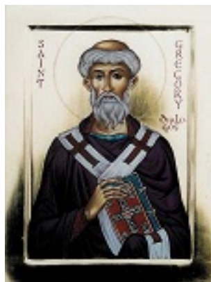
Όσιος Γρηγόριος ο Α' Διάλογος Πάπας Ρώμης