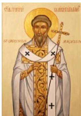
Όσιος Γρηγόριος ο Α' Διάλογος Πάπας Ρώμης