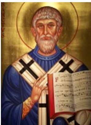
Όσιος Γρηγόριος ο Α' Διάλογος Πάπας Ρώμης