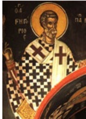
Όσιος Γρηγόριος ο Α' Διάλογος Πάπας Ρώμης