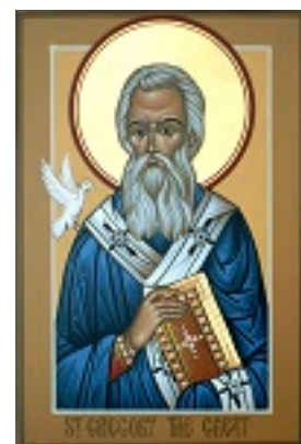
Όσιος Γρηγόριος ο Α' Διάλογος Πάπας Ρώμης