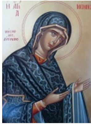
Αγία Μόνικα μητέρα του Αγίου Αυγουστίνου