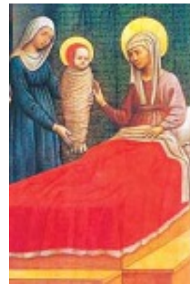
Αγία Μόνικα μητέρα του Αγίου Αυγουστίνου