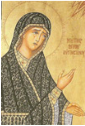
Αγία Μόνικα μητέρα του Αγίου Αυγουστίνου