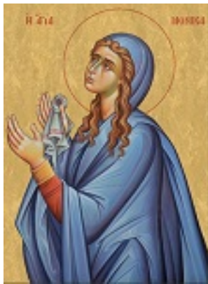
Αγία Μόνικα μητέρα του Αγίου Αυγουστίνου