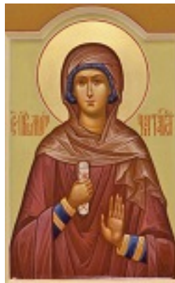
Αγία Μόνικα μητέρα του Αγίου Αυγουστίνου