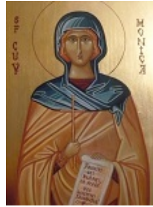
Αγία Μόνικα μητέρα του Αγίου Αυγουστίνου