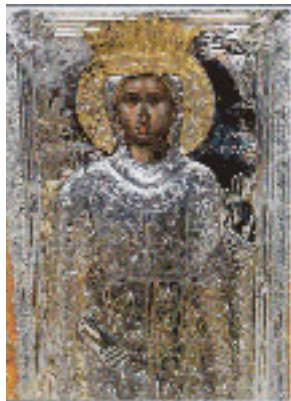
Οσία Θεοδώρα η βασίλισσα Άρτας