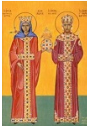
Οι άγιοι Ιωάννης Βατάτζης ο εκ Διδυμοτείχου αυτοκράτορας της Ρωμανίας και Θεοδώρα Πετραλείφα βασίλισσα της Άρτας - Διά χειρός Δέσποινας Σαρσάκη.