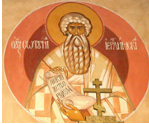
Άγιος Σωφρόνιος<br />Πατριάρχης Ιεροσολύμων