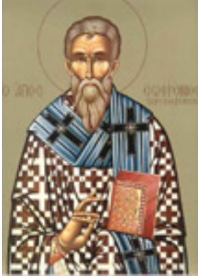
Άγιος Σωφρόνιος<br />Πατριάρχης Ιεροσολύμων