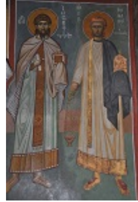
Ο Άγιος Ρωμανός ο Μελωδός και ο Άγιος Ιωσήφ ο Υμνογράφος, ναός Καπνικαρέας