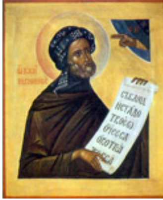
Όσιος Ιωσήφ ο Υμνογράφος