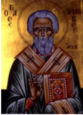
Άγιος Γρηγόριος Επίσκοπος Άσσου