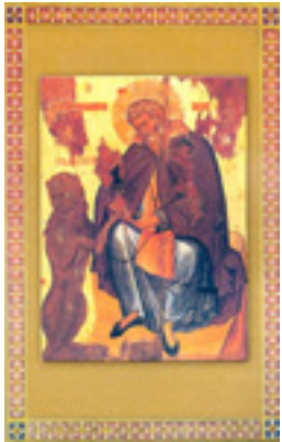
Όσιος Γεράσιμος<br />ο Ιορδανίτης Όσιος Γεράσιμος<br />ο Ιορδανίτης Όσιος Γεράσιμος<br />ο Ιορδανίτης