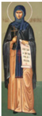
Οσία Δομνίνα<br />η Νέα