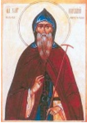
Άγιος Κορνήλιος ο Ιερομάρτυρας εκ Ρωσίας