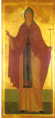
Άγιος Κορνήλιος ο Ιερομάρτυρας εκ Ρωσίας