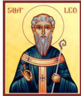
Άγιος Λέων Θαυματουργός Κατάνης