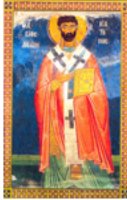
Άγιος Λέων Θαυματουργός Κατάνης