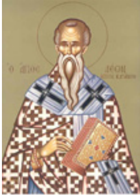
Άγιος Λέων Θαυματουργός Κατάνης