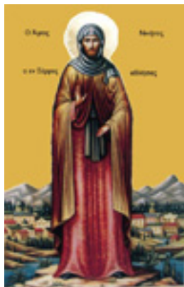
Άγιος Νικήτας ο νέος Ιερομάρτυρας