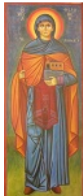
Αγία Φιλοθέη η Αθηναία - Ησυχαστήριο «Παναγία των Βρυούλων»