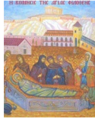
Η κοίμηση της Αγίας Φιλοθέης - Ησυχαστήριο «Παναγία των Βρυούλων»