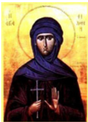
Αγία Φιλοθέη η Αθηναία