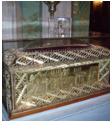
Η ασημένια λειψανοθήκη της Αγίας Φιλοθέης (Μητροπολιτικός Ναός - Αθήνα)