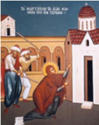
Αγία Φιλοθέη η Αθηναία