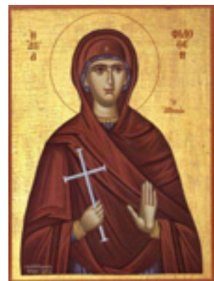
Αγία Φιλοθέη η Αθηναία