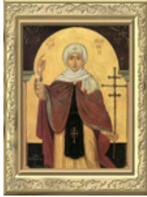
Αγία Φιλοθέη η Αθηναία