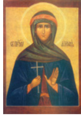
Αγία Φιλοθέη η Αθηναία