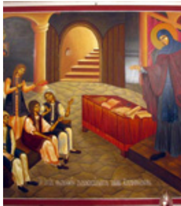
Η Αγία Φιλοθέη διδάσκει τις Ελληνίδες