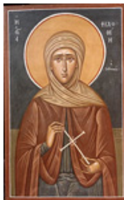
Αγία Φιλοθέη η Αθηναία