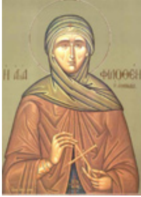
Αγία Φιλοθέη η Αθηναία