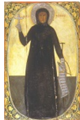
Αγία Φιλοθέη η Αθηναία