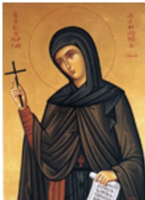
Αγία Φιλοθέη η Αθηναία