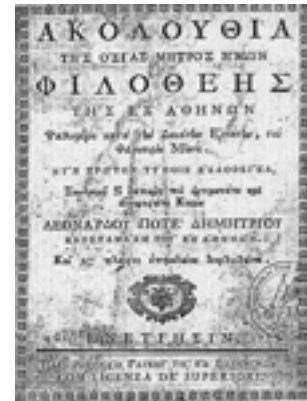
Το εξώφυλλο της έκδοσης της πρώτης ακολουθίας της Αγίας, Βενετία 1775 μ.Χ.