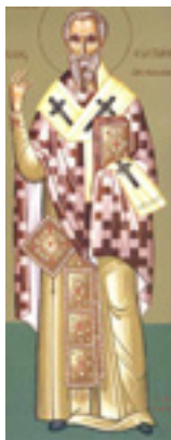
Άγιος Ευστάθιος<br />Αρχιεπίσκοπος Αντιοχείας<br />της Μεγάλης