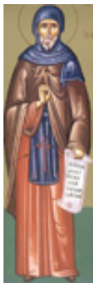
Όσιος Τιμόθεος Συμβόλις